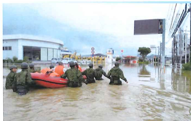
2019年8月 佐賀豪雨災害状況