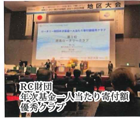
RC財団 年次基金一人当たり寄付額 優秀クラブ