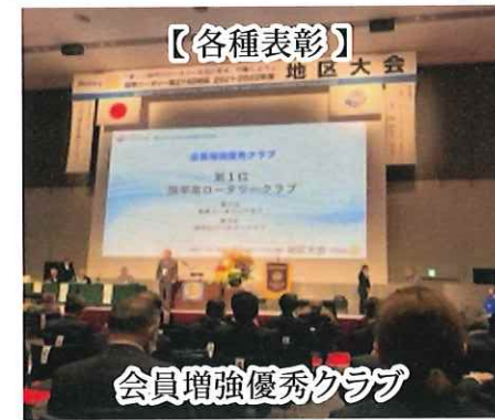
会員増強優秀クラブ