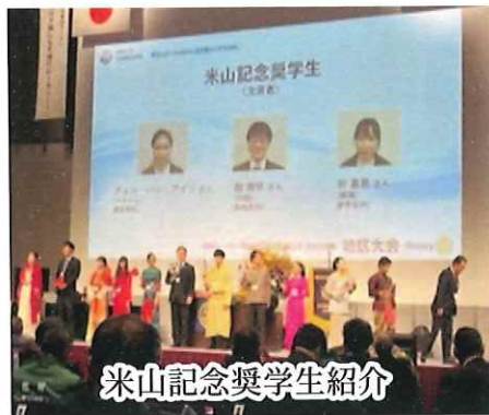
米山記念奨学生紹介