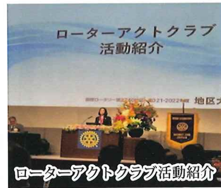
ローターアクトクラブ活動紹介