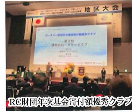
RC財団年次基金寄付額優秀クラブ