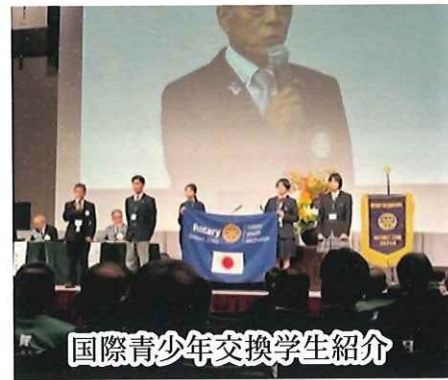
国際青少年交換学生紹介