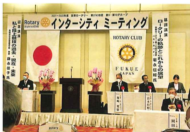
IM開始前の会場の様子 カンパーナホテル