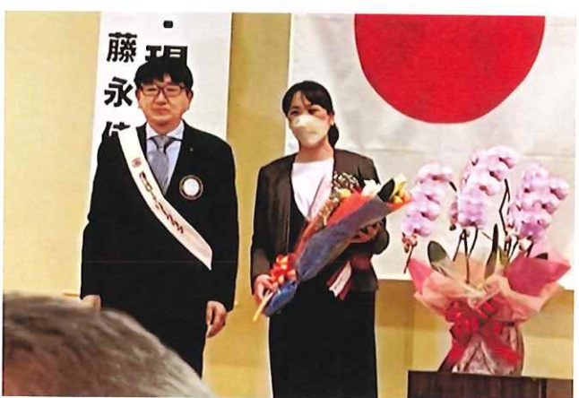
記念講演を終えて 福江ロータリークラブより感謝の花束贈呈