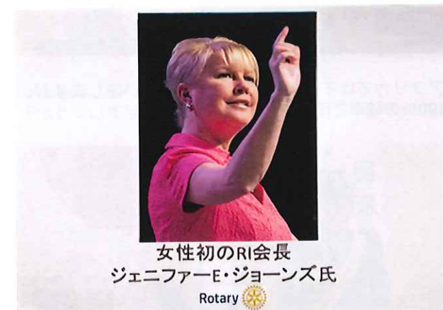
女性初のRI会長 ジェニファー・E・ジョーンズ氏 Rotary