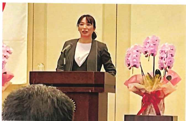
講演の前に謎解き アフリカでは干ばつになった時に雨乞いをしますが、 100%の確率で雨が降ります。それは、なぜでしょうか？