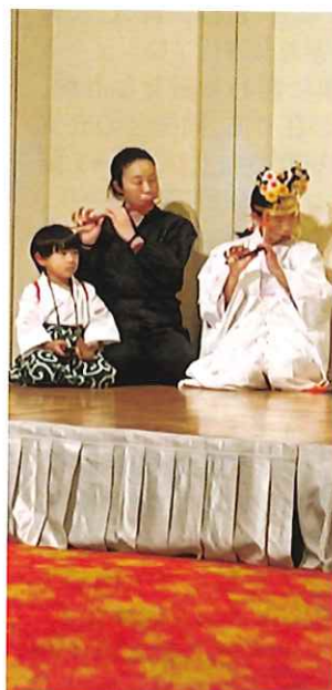
福江神楽 住吉神社神楽保存会