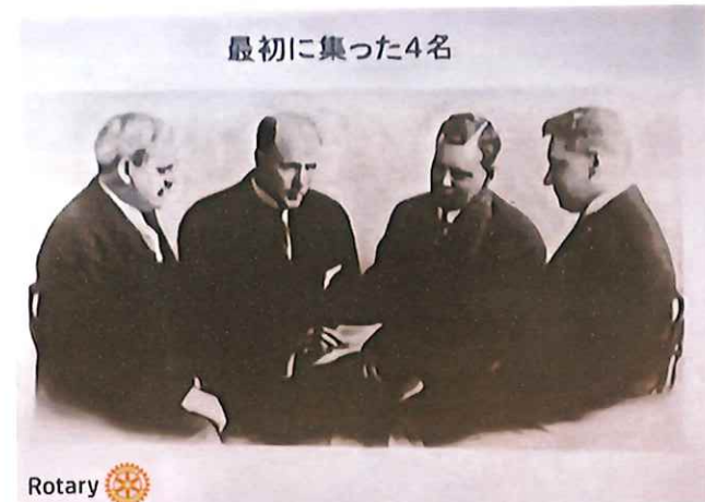
最初に集った4名 4人のロータリー 先駆者たち ガスターバス・ローア シルベスター・シール ハイラム・E・ショーラー ポール・P・ハリス

考えられました。実際に今年度は佐世保北RCがスポンサーとなり、「佐世保北フレンドシップロータリー衛星クラブ」が誕生しました。ロータリー衛星クラブの特徴。スポンサーとなる親クラブが必要です。衛星クラブの会員は、自動的に親クラブの会員となりますが、もちろん、衛星クラブの立派な会員でもありますので、その意味では二重籍を認めた形となります。親クラブにとっては、会員増強につながるメリットがあります。会員数が順調に増えていった場合、衛星クラブのままでいるのか、ロータリークラブに移行するのか選択することができます。会長は衛星クラブでは議長と称されます。