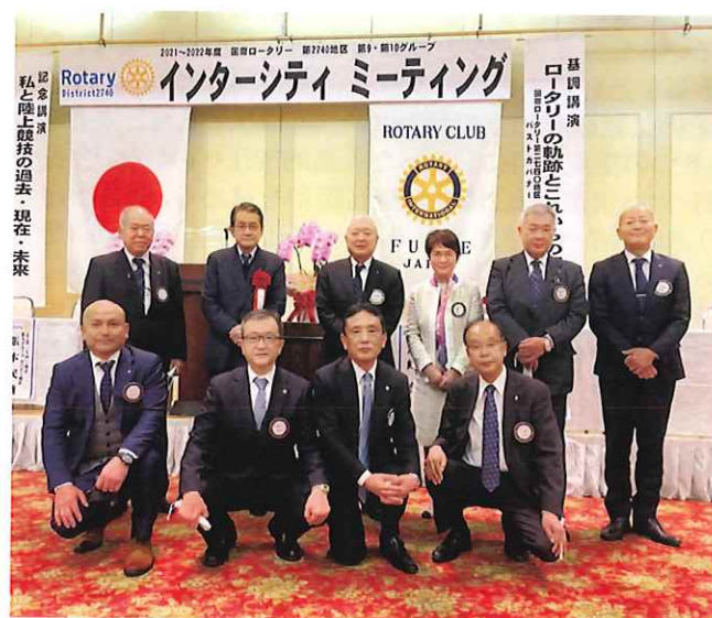
IM参加の会友の皆様、大変お疲れさまでした！！