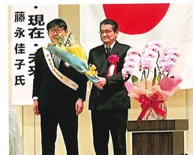
基調講演が終わって 福江ロータリークラブより感謝の花束贈呈