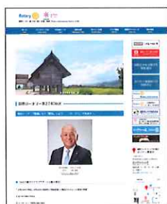
国際ロータリー第2740地区公式WEBサイト