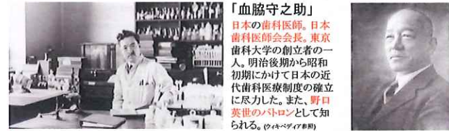
「血脇守之助」 日本の歯科医師。日本 歯科大学の創立者の一 人。明治後期から昭和 初期にかけて日本の近 代歯科医療制度の確立 に尽力した。また、野口 英世のハズレとして知 られる。(Wikipedia参照)