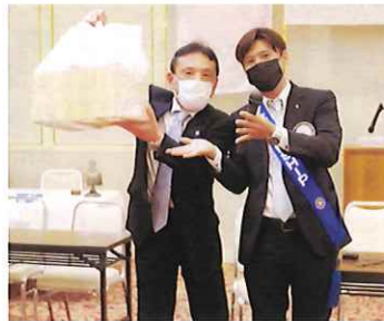
優勝テーブルは1 番テーブル