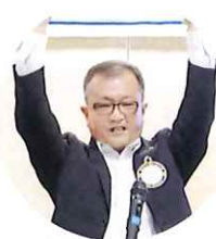
万歳三唱 西岡会友