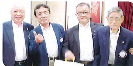
優勝は2番テーブル！